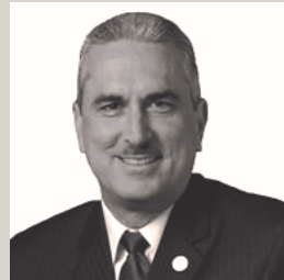
Thomas Rivera Schatz